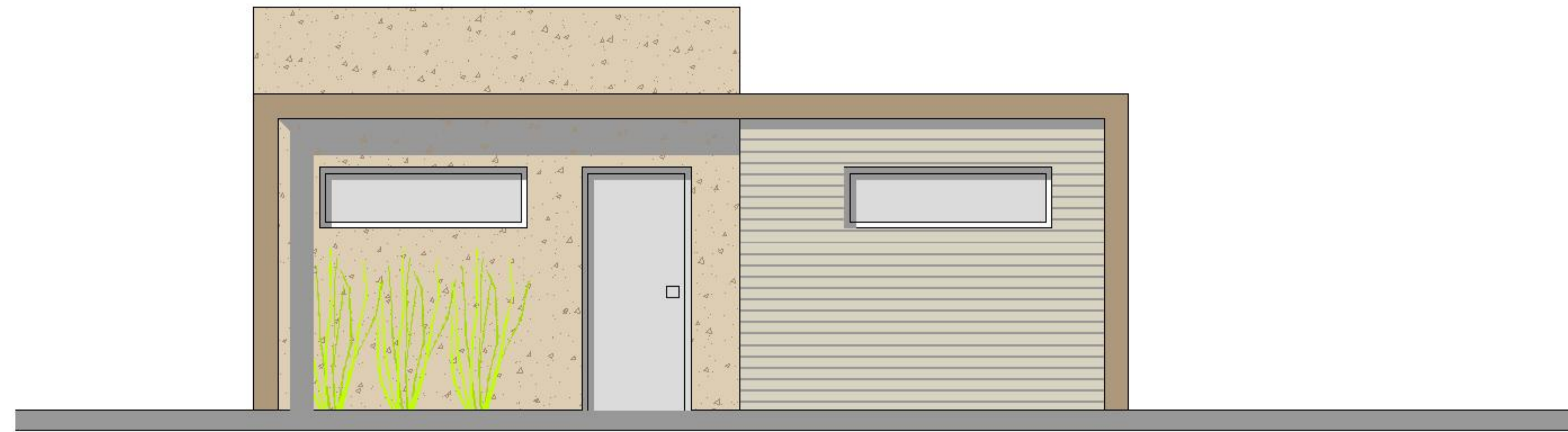
Alzada lateral. Esc. 1:100