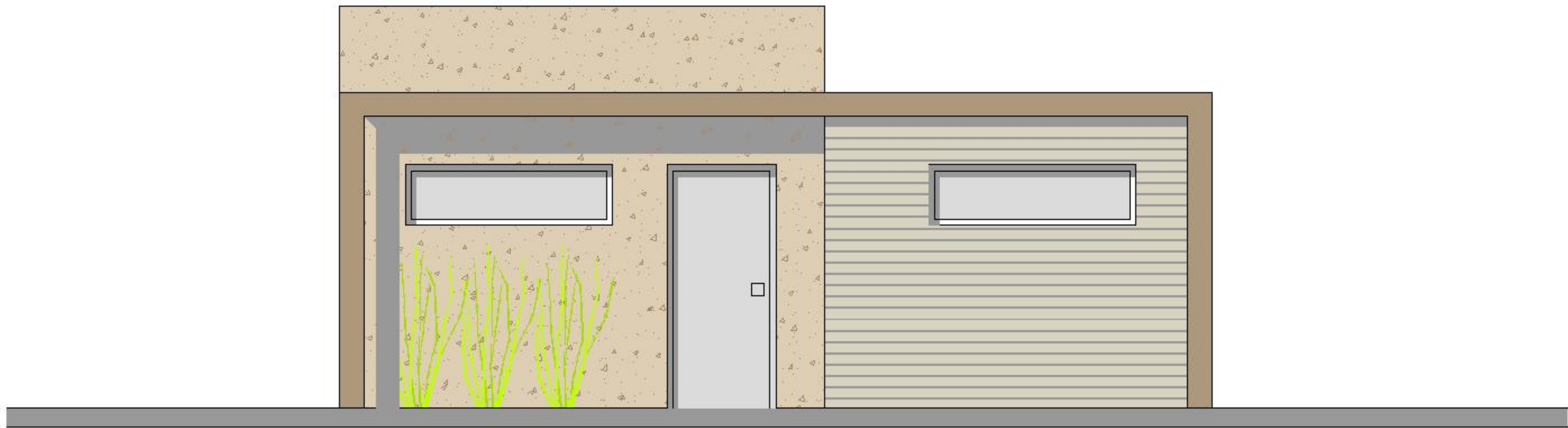
Alzada lateral. Esc. 1:100